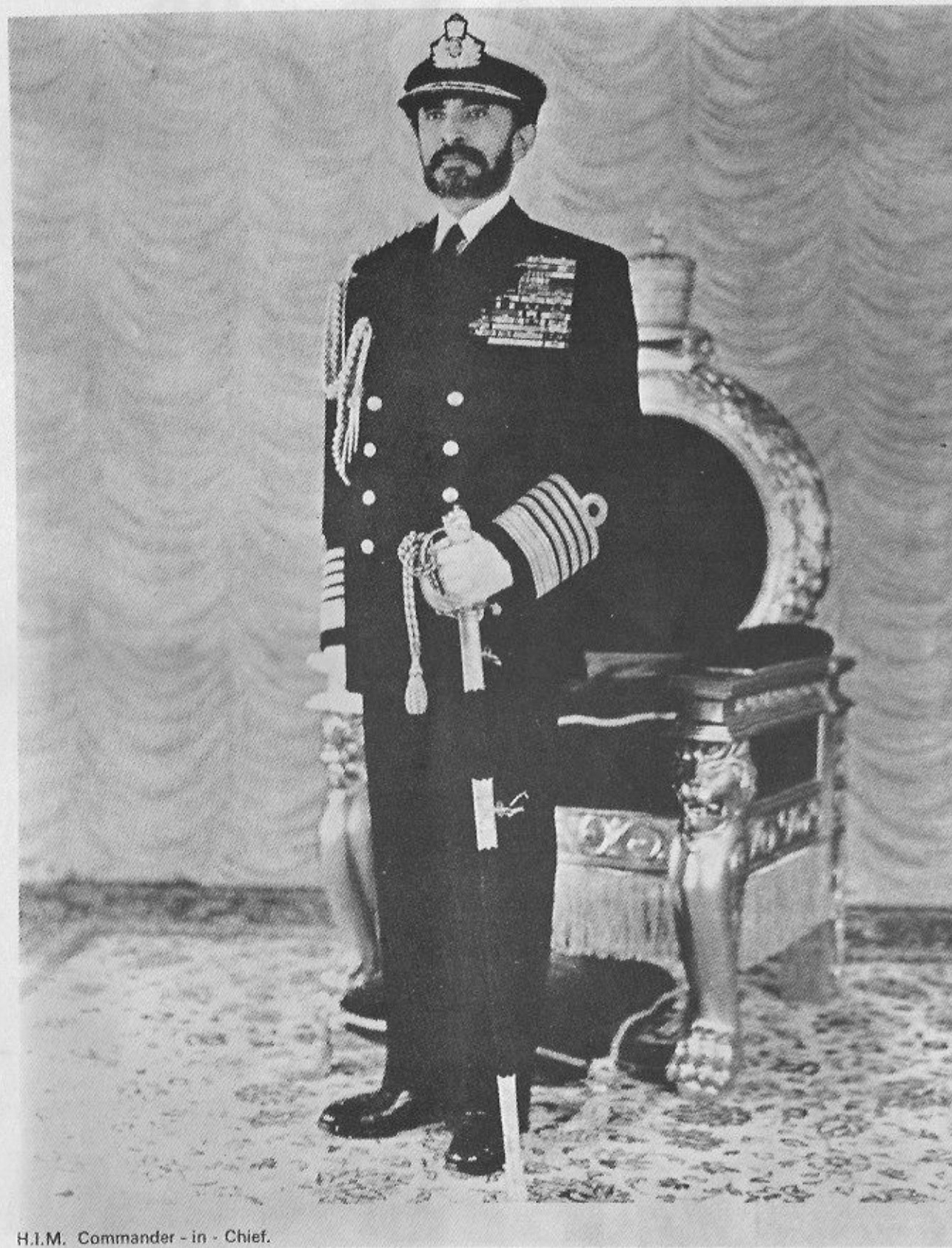
H.I.M. Commander - in - Chief.

A Typical nineteenth Century Dhow from Massawa