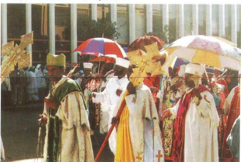
Asmara 1990 - Cerimonia religiosa in occasione dei festeggiamenti per la liberazione.