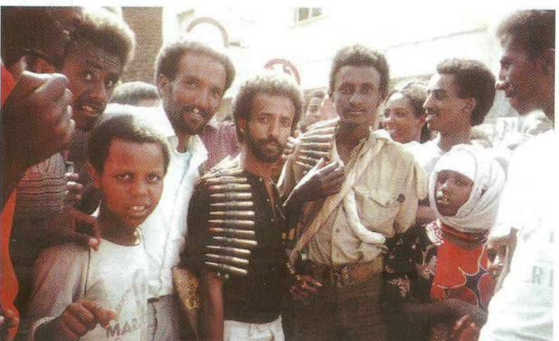
Asmara 1990 - Guerriglieri attornati da connazionali eritrei in bella posa nella giornata trionfale della liberazione.