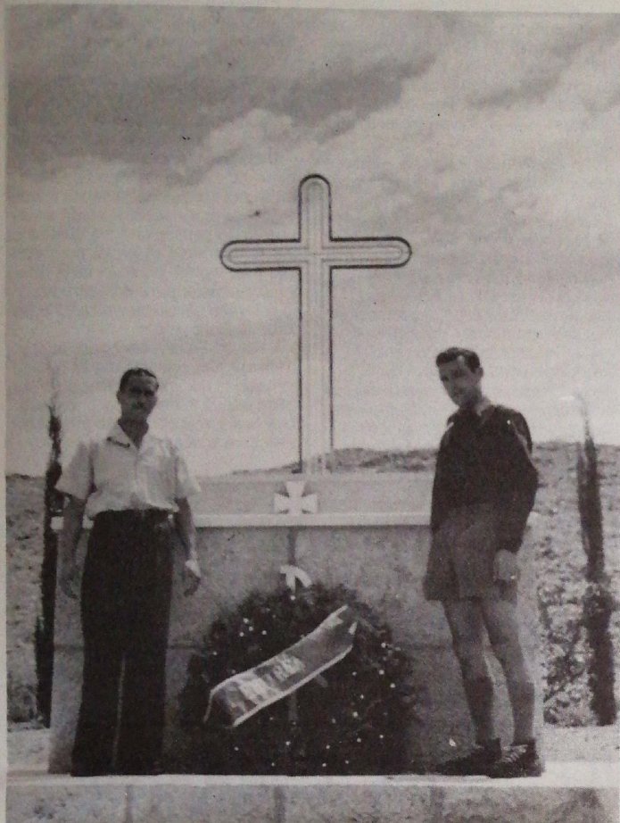
Cheren 1945 - Romeo e Avoni rendono omaggio ai caduti di Cheren.