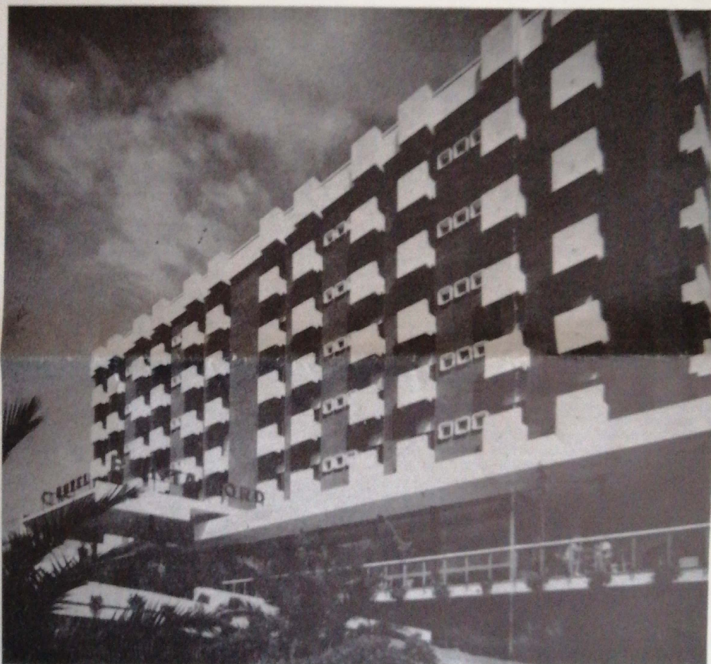
Veduta dell'Hotel Punta Nord di Rimini, sede del IX Raduno asmarini.