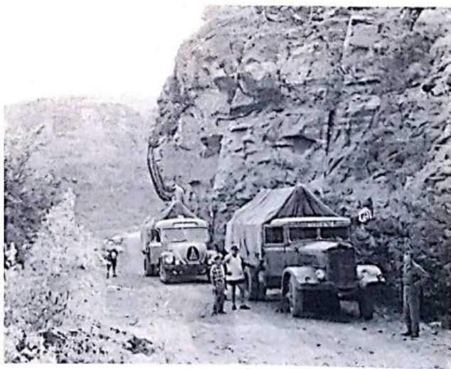
Autotreni di ritorno dal Goggiam.