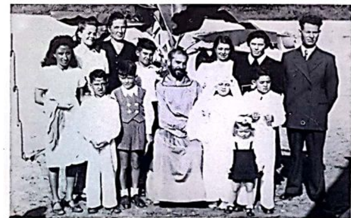
Eritrea 1947 - Prima comunione nel campo di sfollamento di Dongollo (Ghinda).

E' perciò non aggiungiamo altro che un affettuoso fraterno arrivederci ai nostri medici.