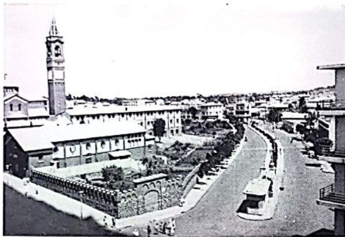
Uno scorcio di Asmara, dietro la cattedrale.....

Ma anche a Vella, direi, sfugge un'asserzione dialetticamente controproducente, là dove afferma che «... gli etiopici non furono da meno degli italiani quanto a violazione del diritto...». Già. Ma gli italiani non erano andati laggiù per portare la civiltà dove regnava la barbarie? E il trionfo della luce sulle tenebre doveva dunque ridursi ad un pargoglio, o ad una stentata vittoria «ai