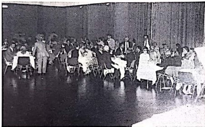
Una parte della sala a Trevi durante il Galà del sabato sera.