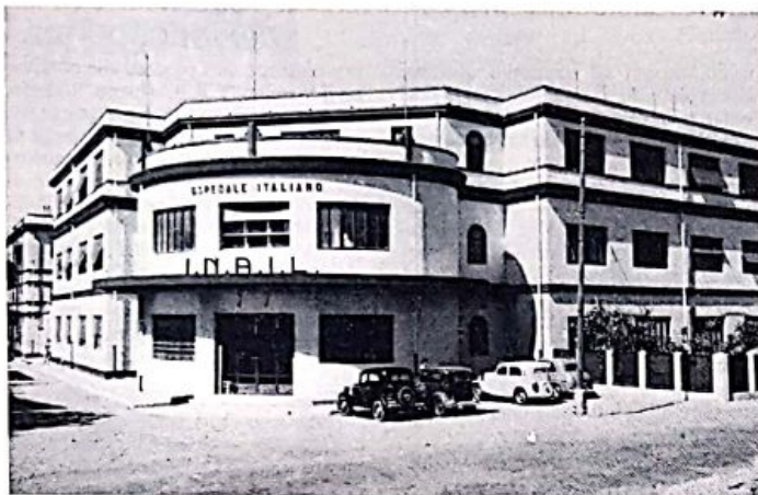
L'entrata dell'Hospitem di Asmara ai tempi in cui era ancora dell'INAIL.