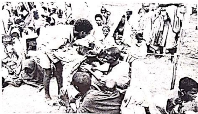
Siamo in uno dei tanti attendamenti nei pressi di Macallé. Anche per oggi un misero pasto è assicurato..... ma domani?.....

Per dieci giorni ho potuto anch'io soccorrere i rifugiati di Makallé. Se non avessi avuto la scuola sarei riamata di più.