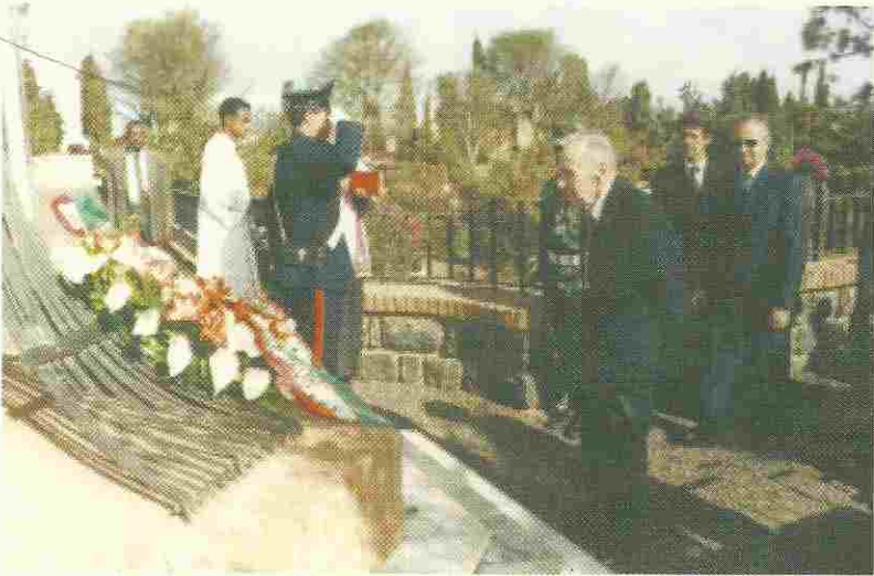
Una corona di fiori in onore dei caduti italiani.