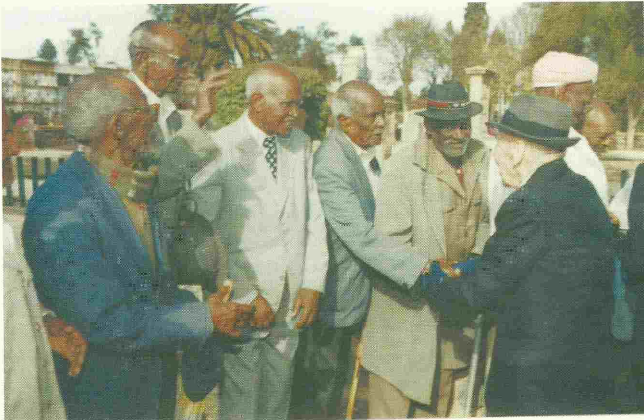
Il Generale Guillet incontra gli ex ascari al Cimitero italiano.