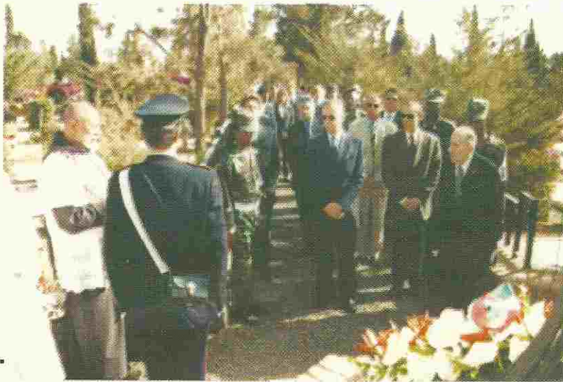
Onore ai caduti al Cimitero italiano di Asmara.