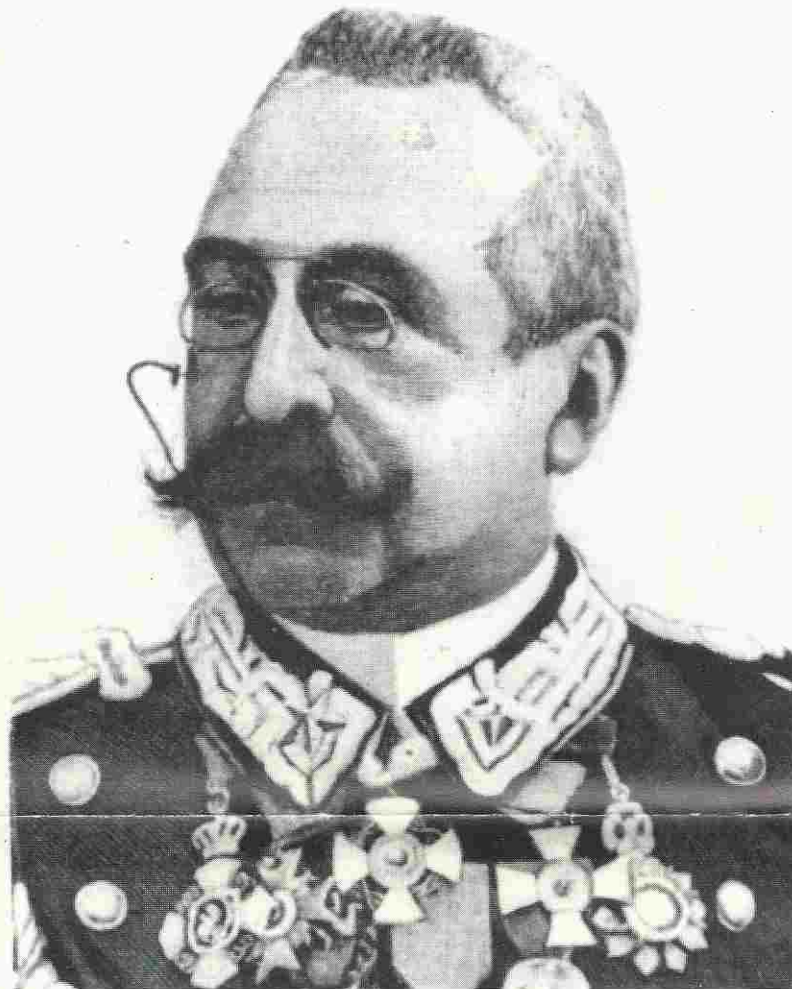
Il generale Oreste Baratieri

Il Toselli, invece di ritirarsi, chiese rinforzi immediati e presto dispose di sei compagnie, e fece irruzione in Saganeiti senza colpo ferire, in quanto Bata ed i suoi armati si ritirarono verso Halai dove stazionava la compagnia Castellazzi, forte di circa 250 uomini. Bata, ormai irritato, non volle trattare con il Castellazzi, che cercava di guadagnare tempo per attendere l'arrivo del Toselli, e lo attaccò con scarse possibilità di difesa della truppa italiana. La situazione sarebbe precipitata se non ci fosse stato il provvidenziale arrivo del Toselli che