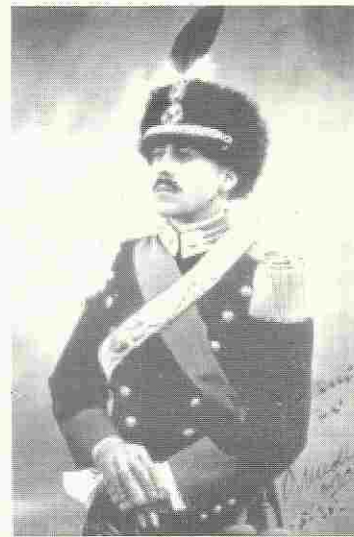
Il tenente Amedeo Guillet quando era nel Reggimento Guide (1932)