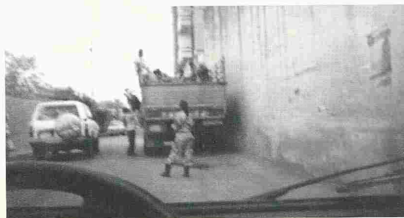
Operazioni militari in Asmara

risposte possono essere molteplici. Vi sono alcuni Stati che desidererebbero che l'Eritrea perdesse la guerra. Altri, e sono tanti, tacciono, non sapendo chi sarà il vincitore e chi il vinto, e quindi preferiscono, per ora, mantenersi neutrali. Pensano, forse, che essendo l'esercito etiopico in stragrande maggioranza rispetto a quello eritreo, sarà l'Etiopia a riportare la vittoria. Da queste posizioni deriva l'embargo posto dal Consiglio di Sicurezza a ambedue i paesi per l'acquisto di armi, pur sapendo che l'Etiopia è l'aggressore e