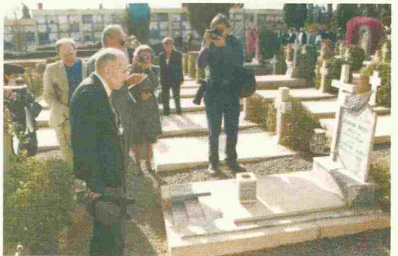
Il Generale Guillet assorto davanti alla tomba dell'eroe Mario Visinitini.