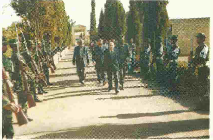
Il picchetto d'onore saluta il Generale Guillet al suo ingresso al Cimitero italiano di Zezerat.