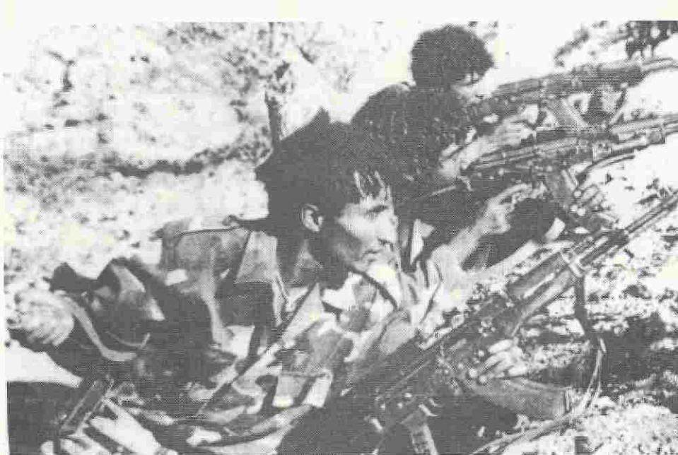
Guerrieri eritrei in prima linea.

Caro Direttore, non ho potuto fare a meno di notare la tendenza del Mai Tacli a sempre più "politicizzarsi" assumendo una posizione a senso unico.