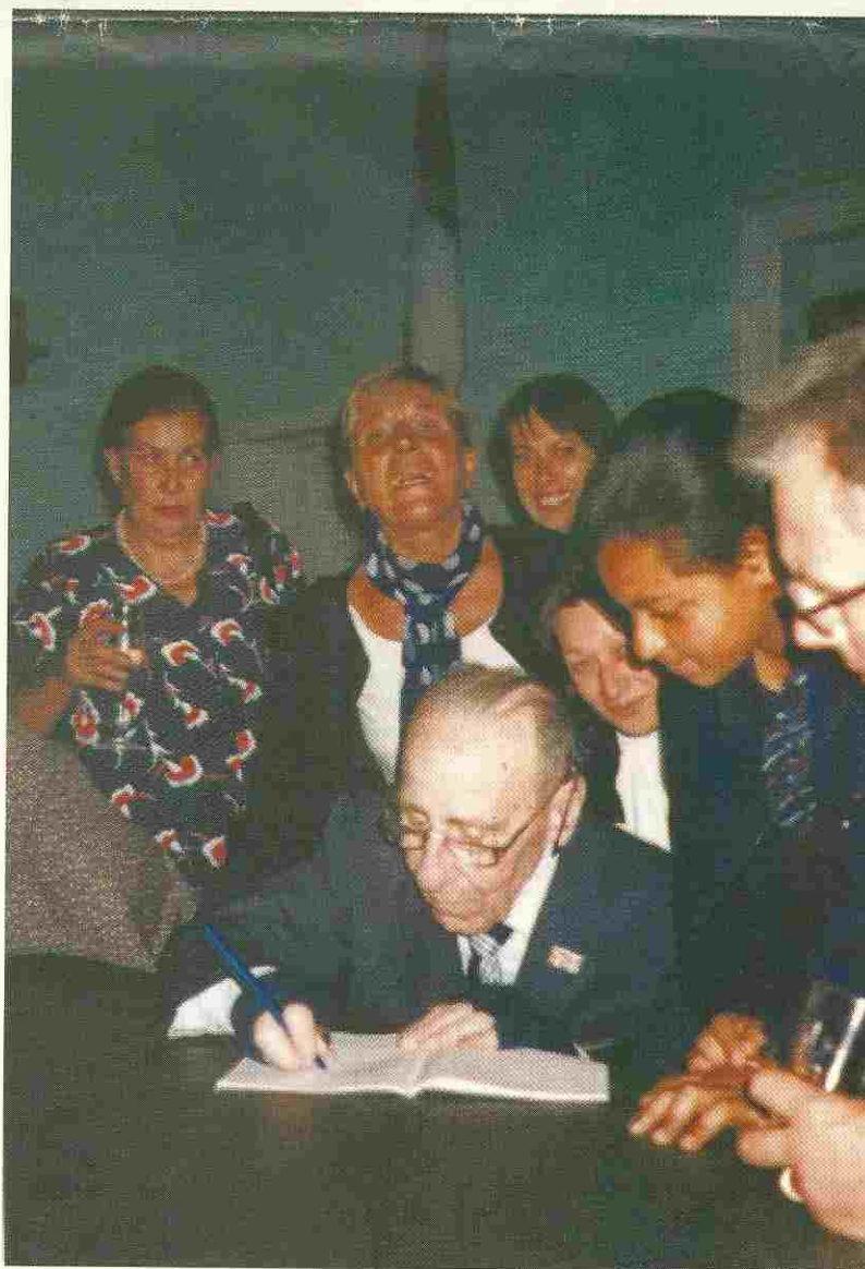
Richieste di autografi alla Casa degli Italiani