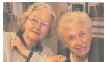
Come siamo diventate