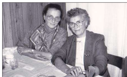
Come siamo state