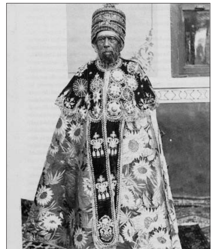
Il ras Menelik

clamò, non a torto vista la grande estensione dei suoi domini, delle decine di etnie che non erano mai state assoggettate e della sottomissione dei regni islamici Harrar e Gimmra, Imperatore: dalla radice imperatore o superior sostituendo l'antico etimo di Re dei Re. Appena nominatosi comunicò la sua decisione ed il suo grado a tutti gli imperatori presenti sulla scena mondiale di allora (Inghilterra, Giappone, Russia) e, seppur non dando importanza, nessuno dei suoi colleghi ebbe nulla da eccepire. In sostanza vuol dire che la presenza di un nuovo impero non incideva sulla scena mondiale. La teoria di un impero dinastico di successori consanguinei che si tramandavano l'impero dai tempi di Salomone non attiene alla Storia ma alla mitologia, come per noi la storia di Romolo. Resta però il fatto della continuità della cultura e della religione, almeno dal 3° secolo