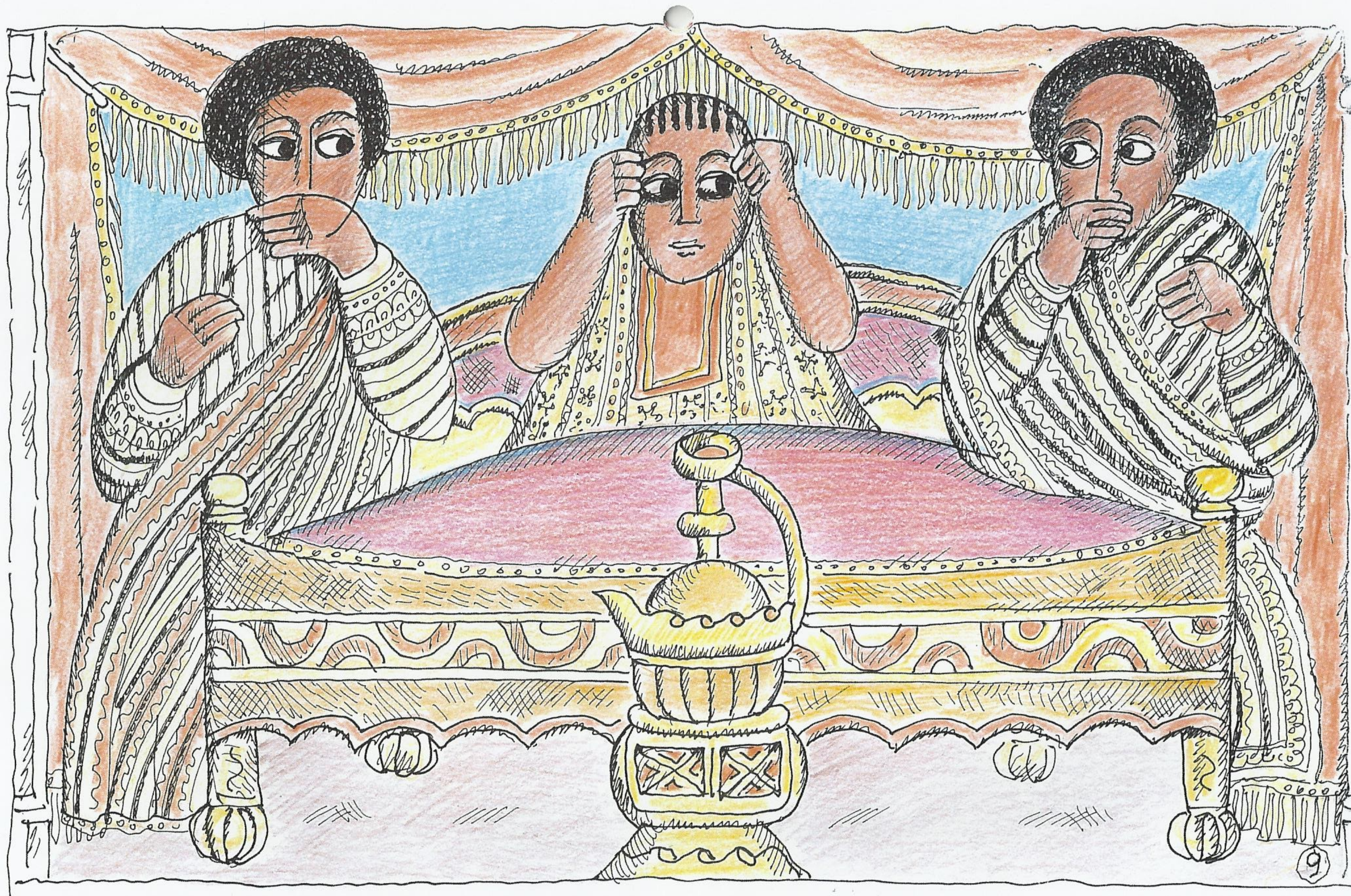
La Regina di Saba giunta alla reggia di Re Salomone ascolta i consigli delle guardie reali. Disegno a china su carta, colorato a matita.