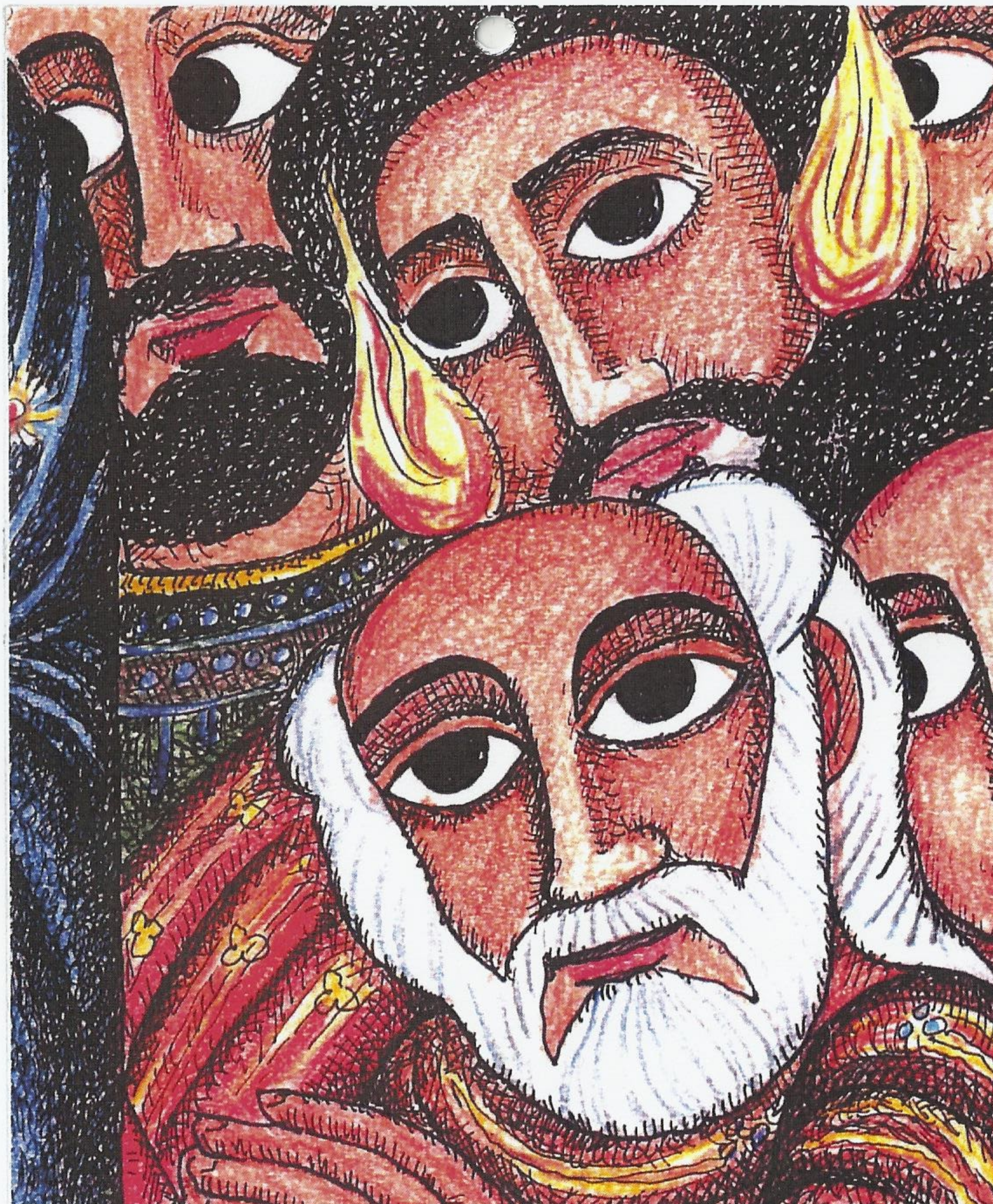
Studio di linee, espressioni, volti e colori della pittura popolare abissina.