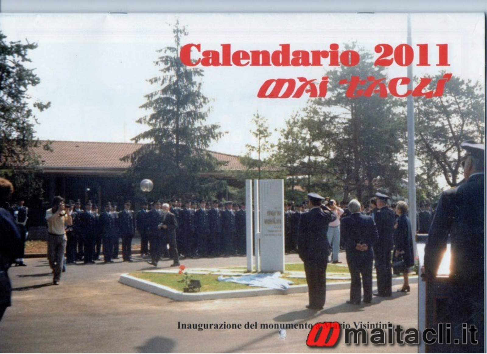
Inaugurazione del monumento a Mario Visintini