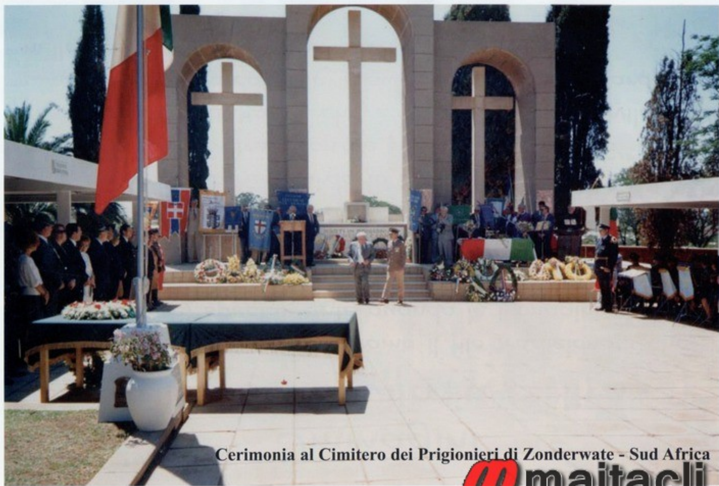
Cerimonia al Cimitero dei Prigionieri di Zonderwate - Sud Africa