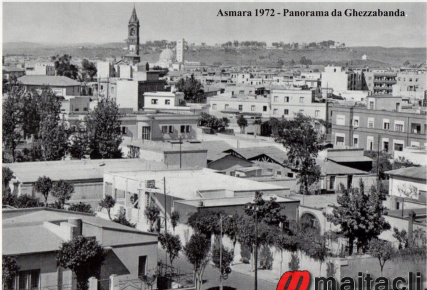
Asmara 1972 - Panorama da Ghezzabanda