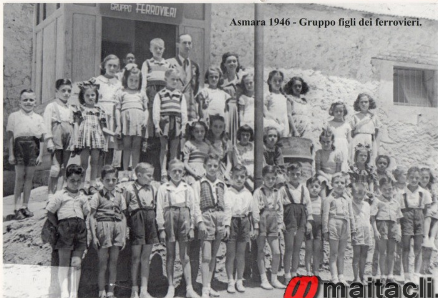
Asmara 1946 - Gruppo figli dei ferrovieri.