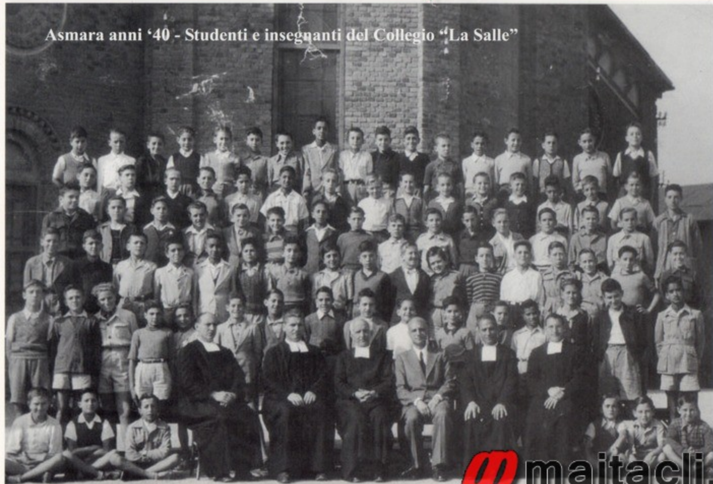
Asmara anni '40 - Studenti e insegnanti del Collegio "La Salle"