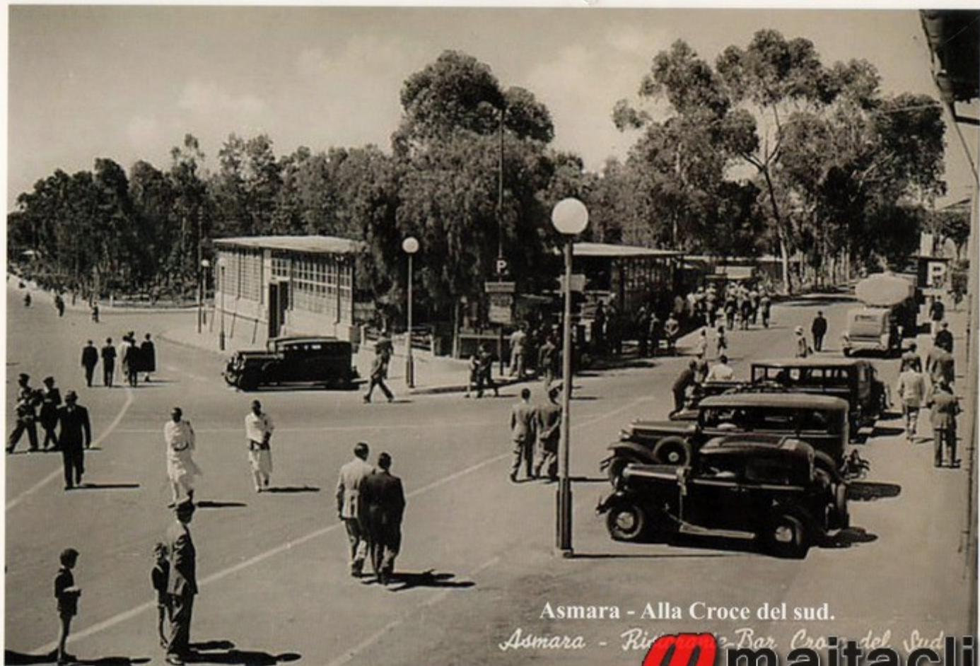
Asmara - Alla Croce del sud.

Asmara - Riva del Mare - Bar Croce del Sud