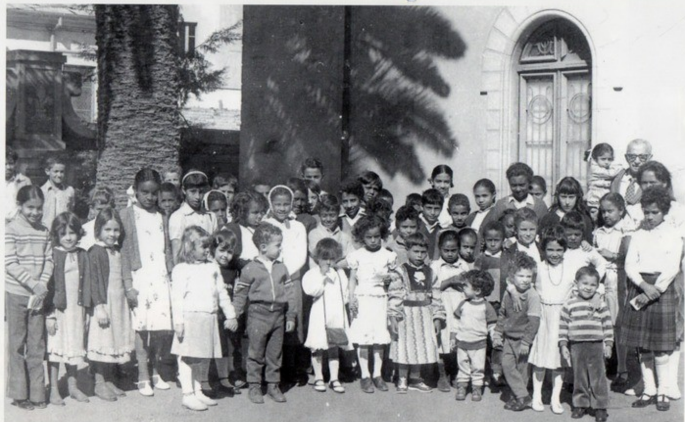
Asmara 1984 - Casa degli italiani - Gruppo di bambini in attesa della Befana