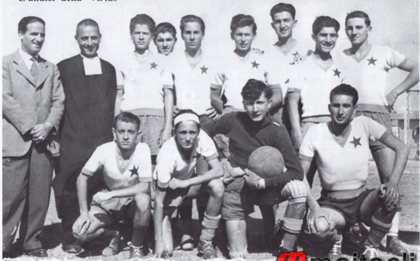
L'undici della "Virtus"