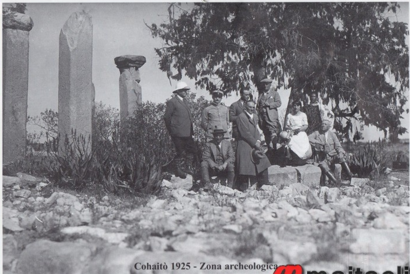
Cohaitò 1925 - Zona archeologica