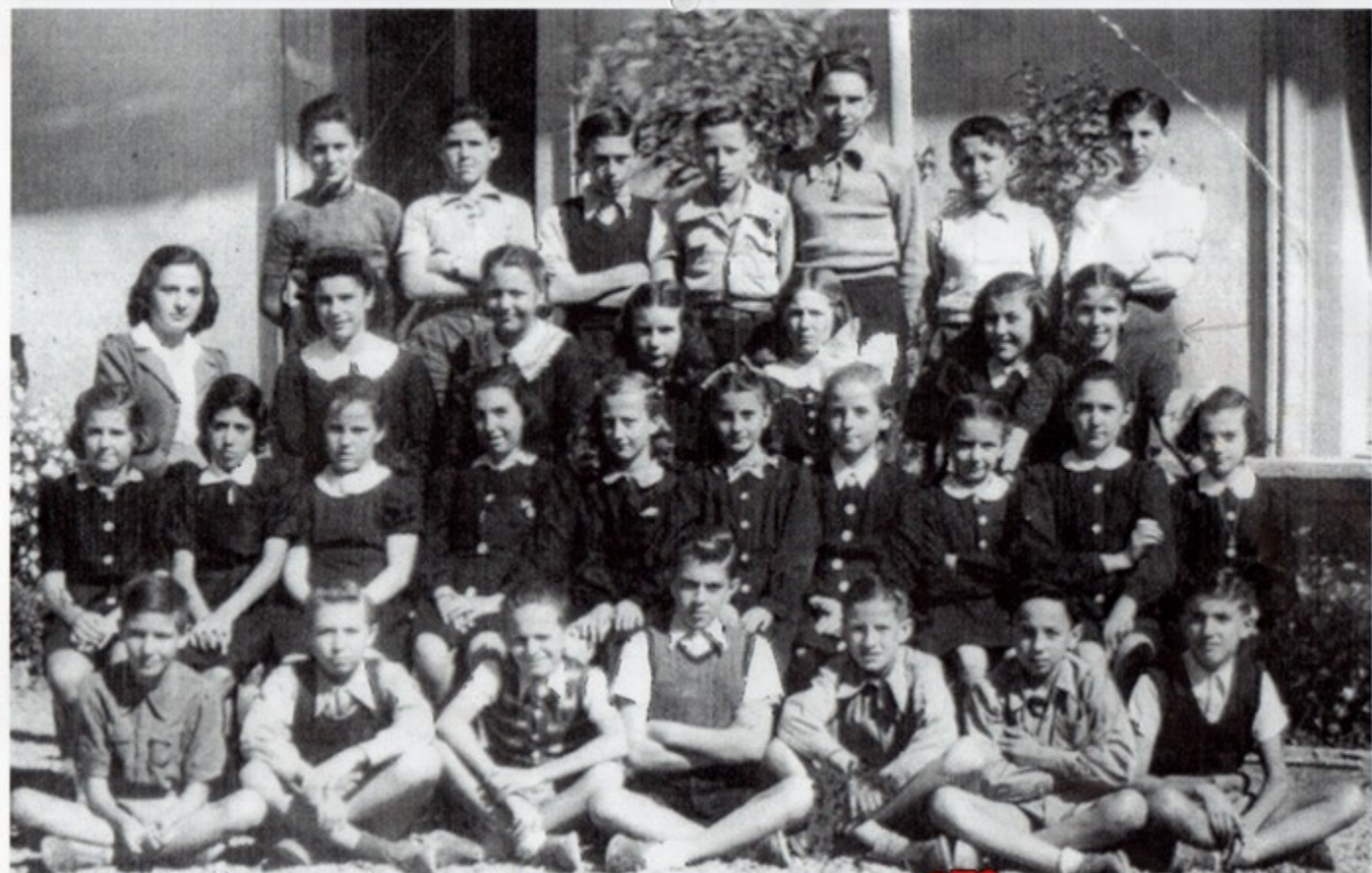
1942/43 - Prima media a Gaggiari