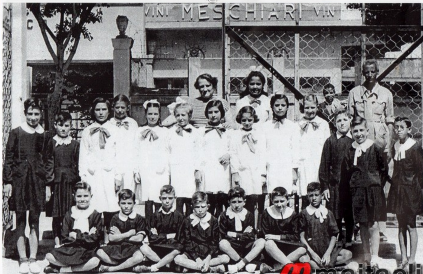
1951-52 - IV Elementare