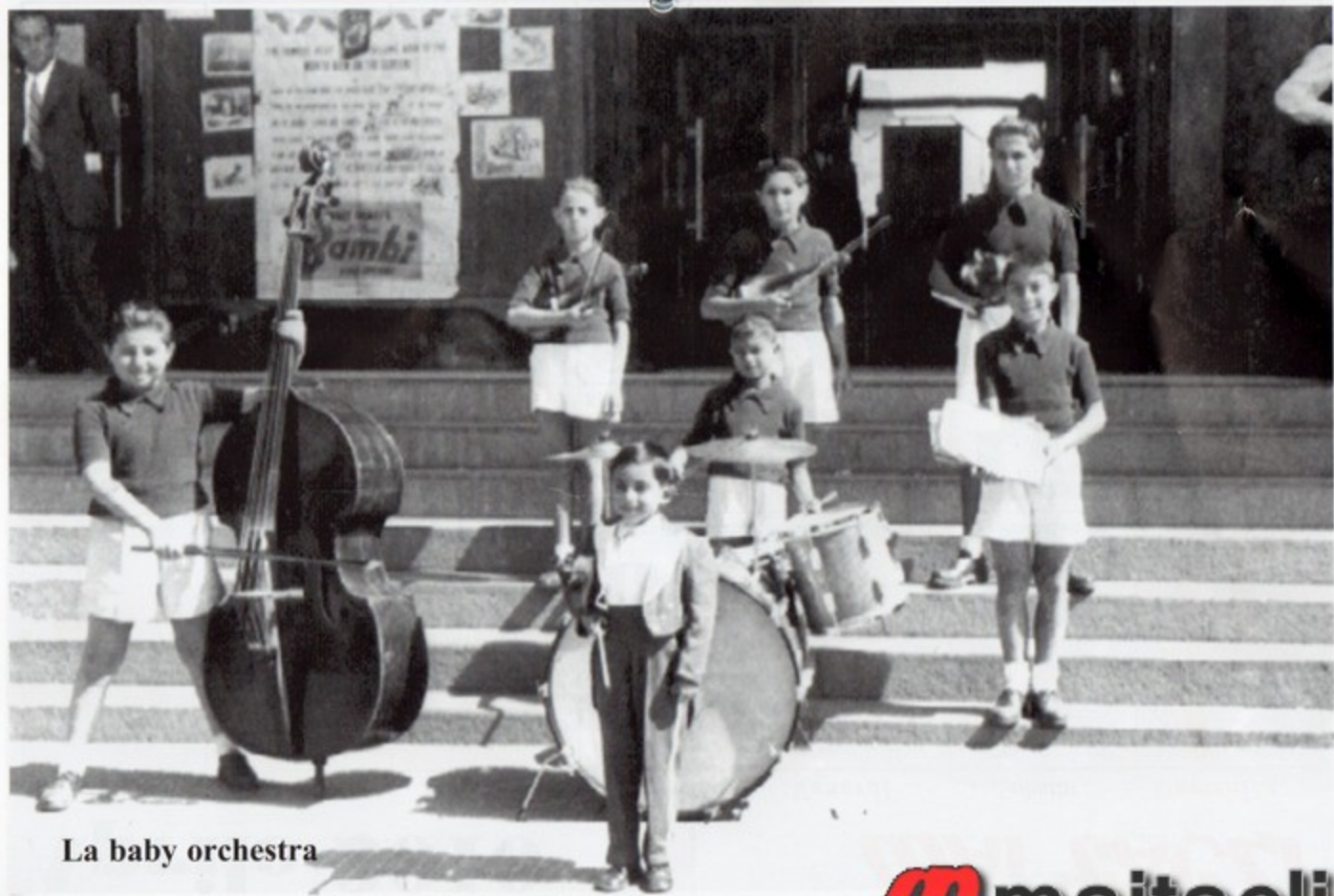
La baby orchestra