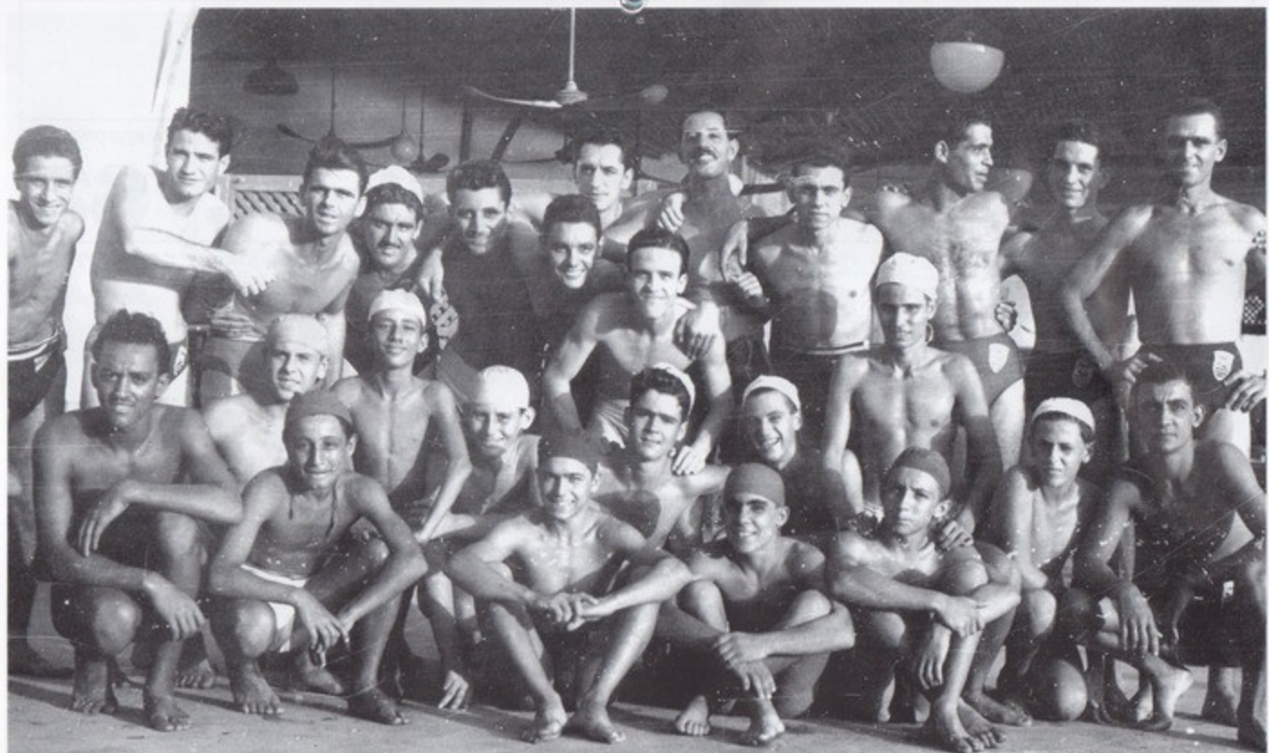
1947 - Nuotatori a Massaua