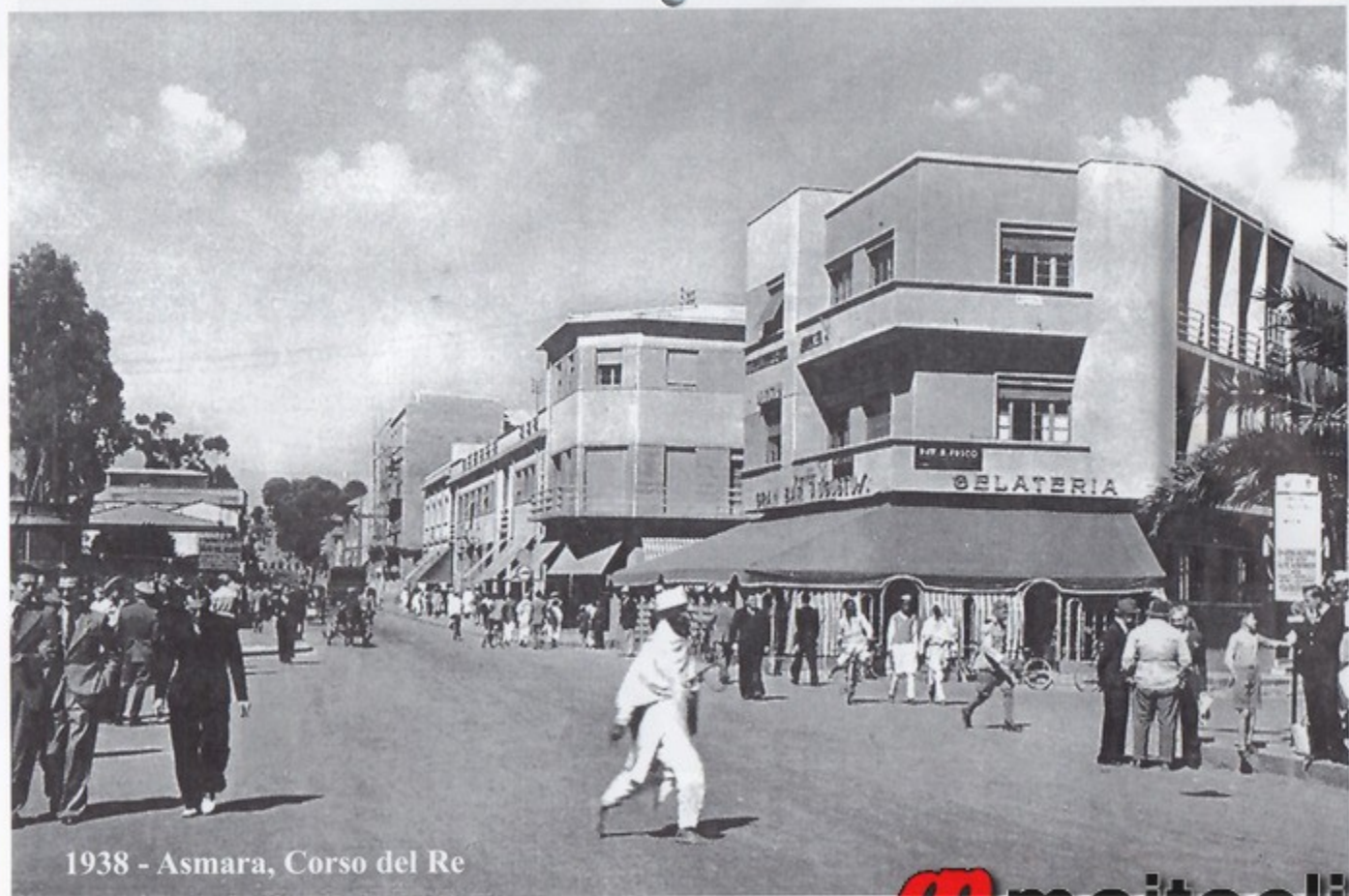
1938 - Asmara, Corso del Re