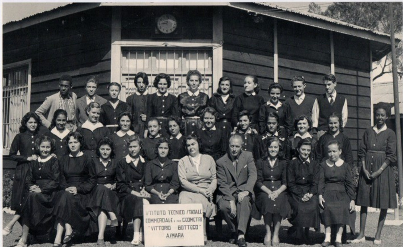
Asmara 1958 - I Istituto Tecnico Vincenzo Bottego