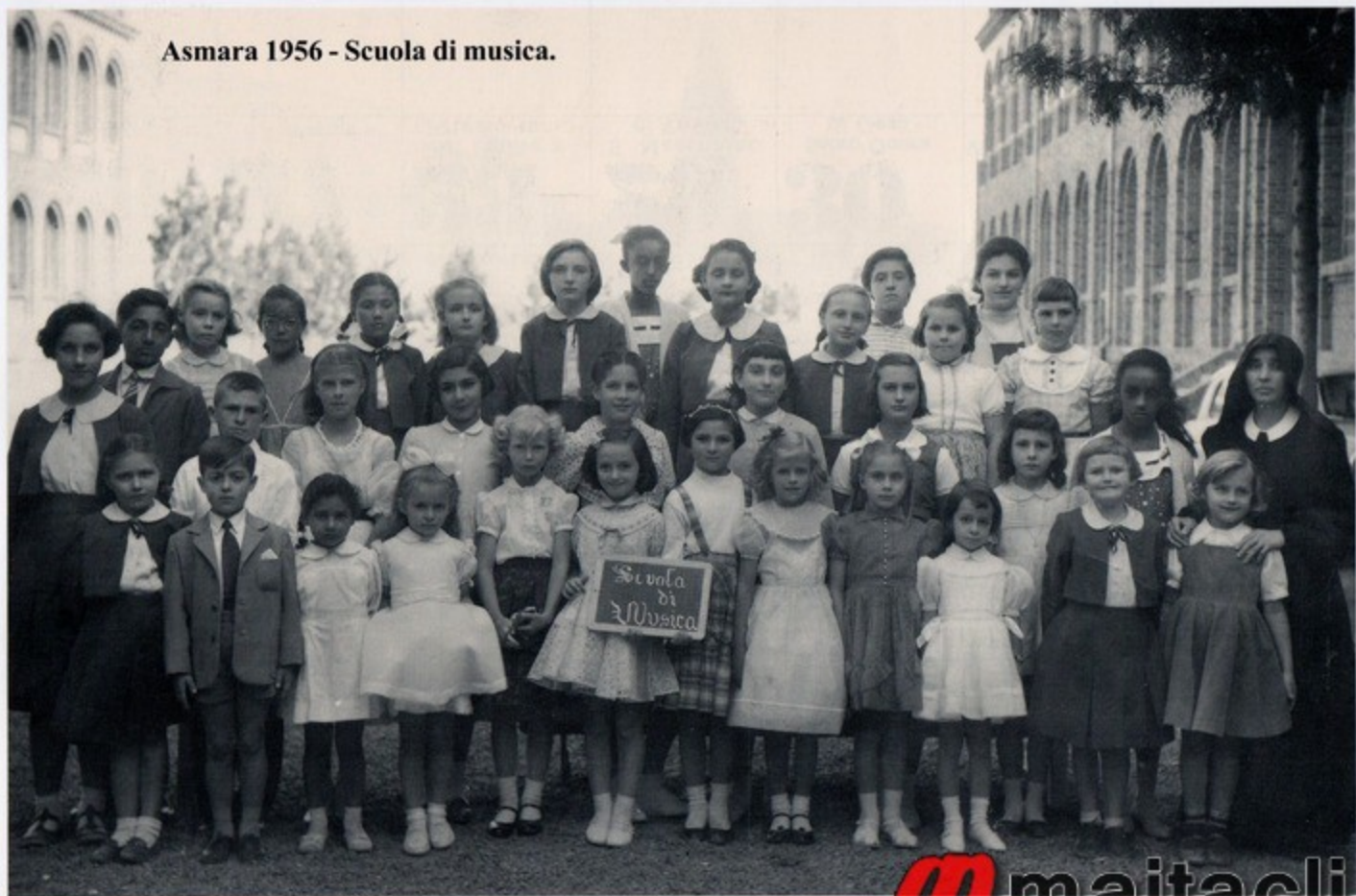
Asmara 1956 - Scuola di musica.