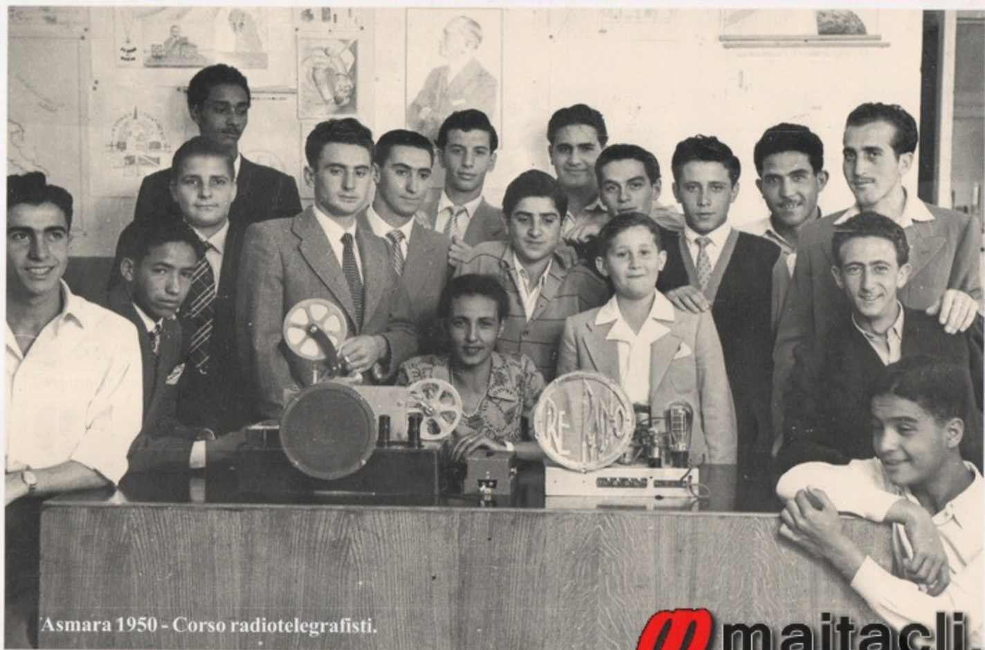
Asmara 1950 - Corso radiotelegrafisti.