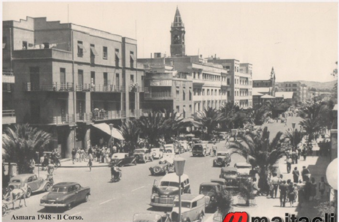
Asmara 1948 - Il Corso.