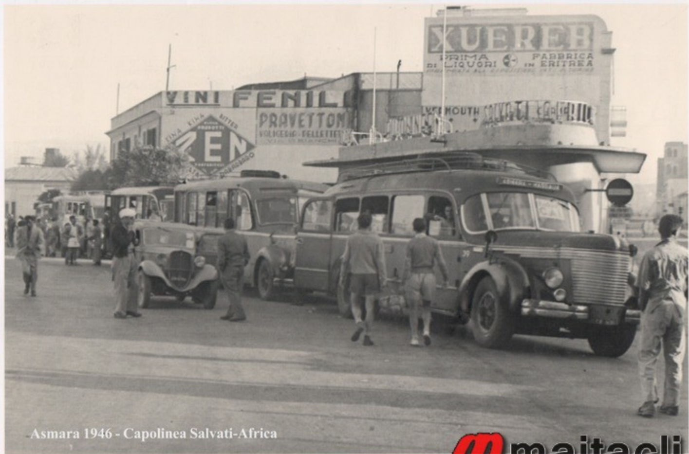
-Asmara 1946 - Capolinea Salvati-Africa