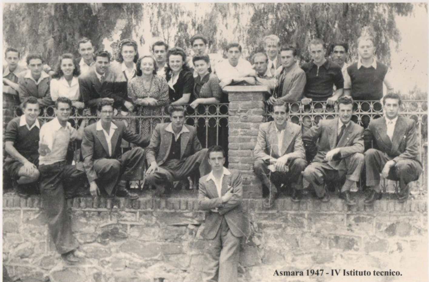
Asmara 1947 - IV Istituto tecnico.