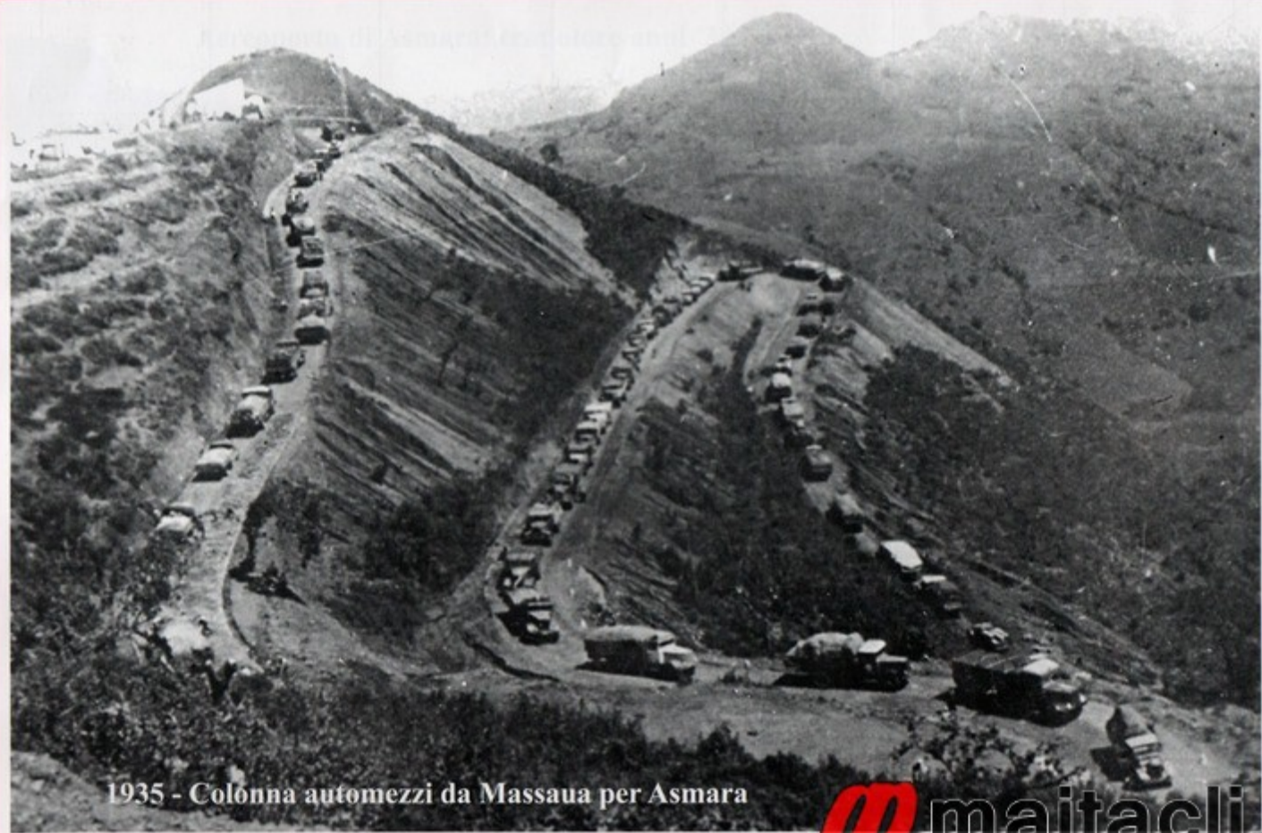
1935 - Colonna automezzi da Massaua per Asmara