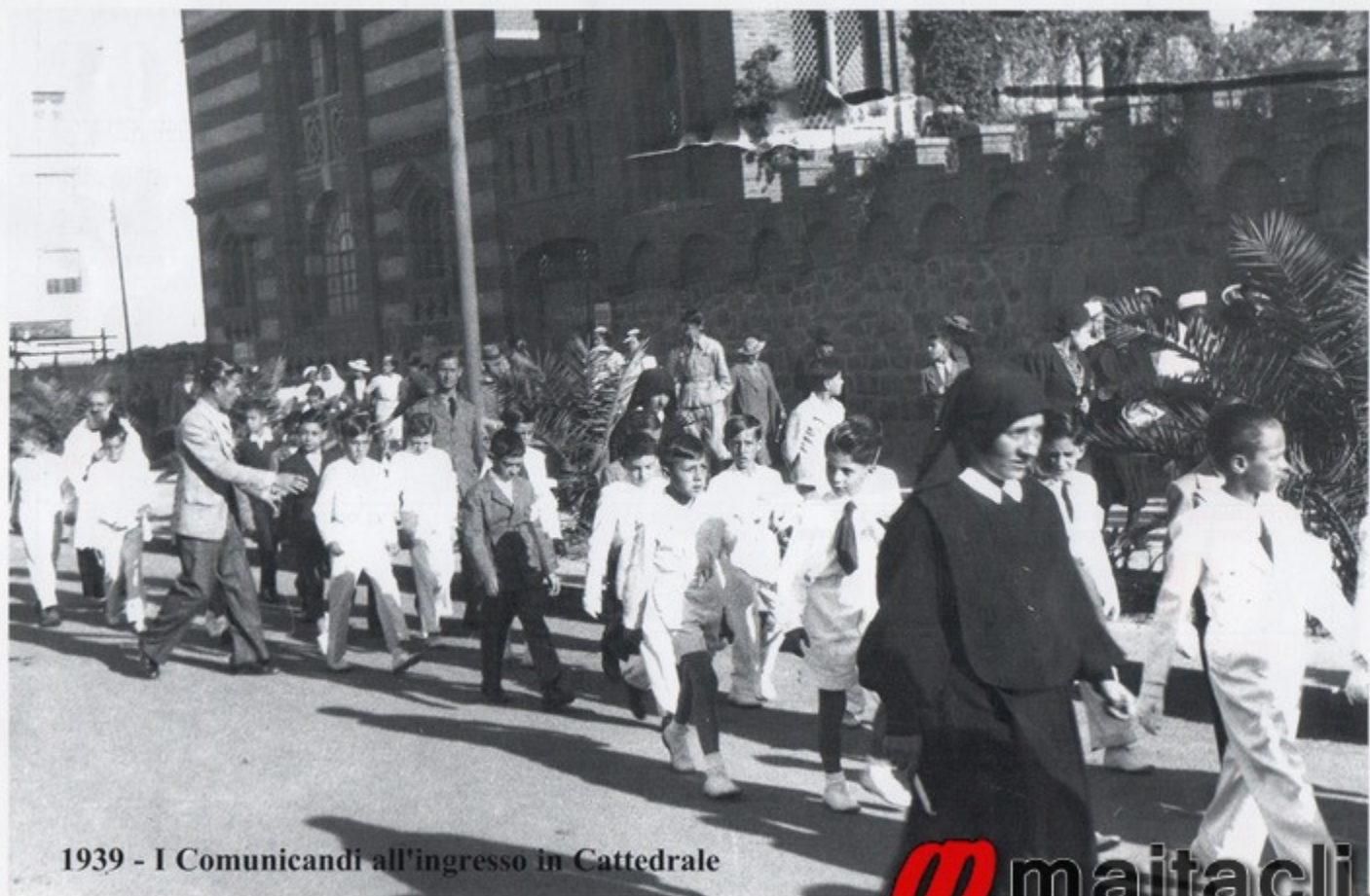
1939 - I Comunicandi all'ingresso in Cattedrale