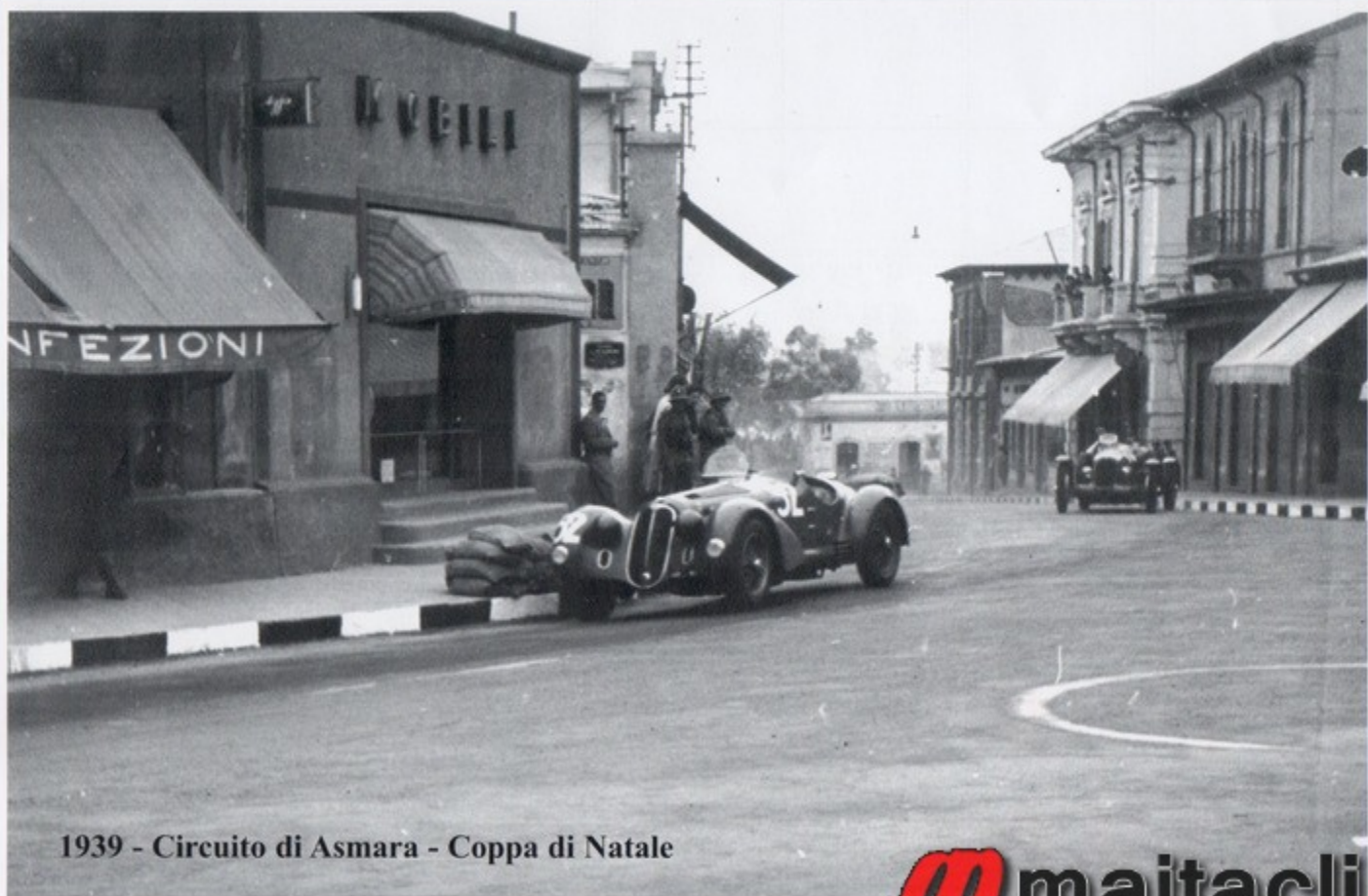
1939 - Circuito di Asmara - Coppa di Natale