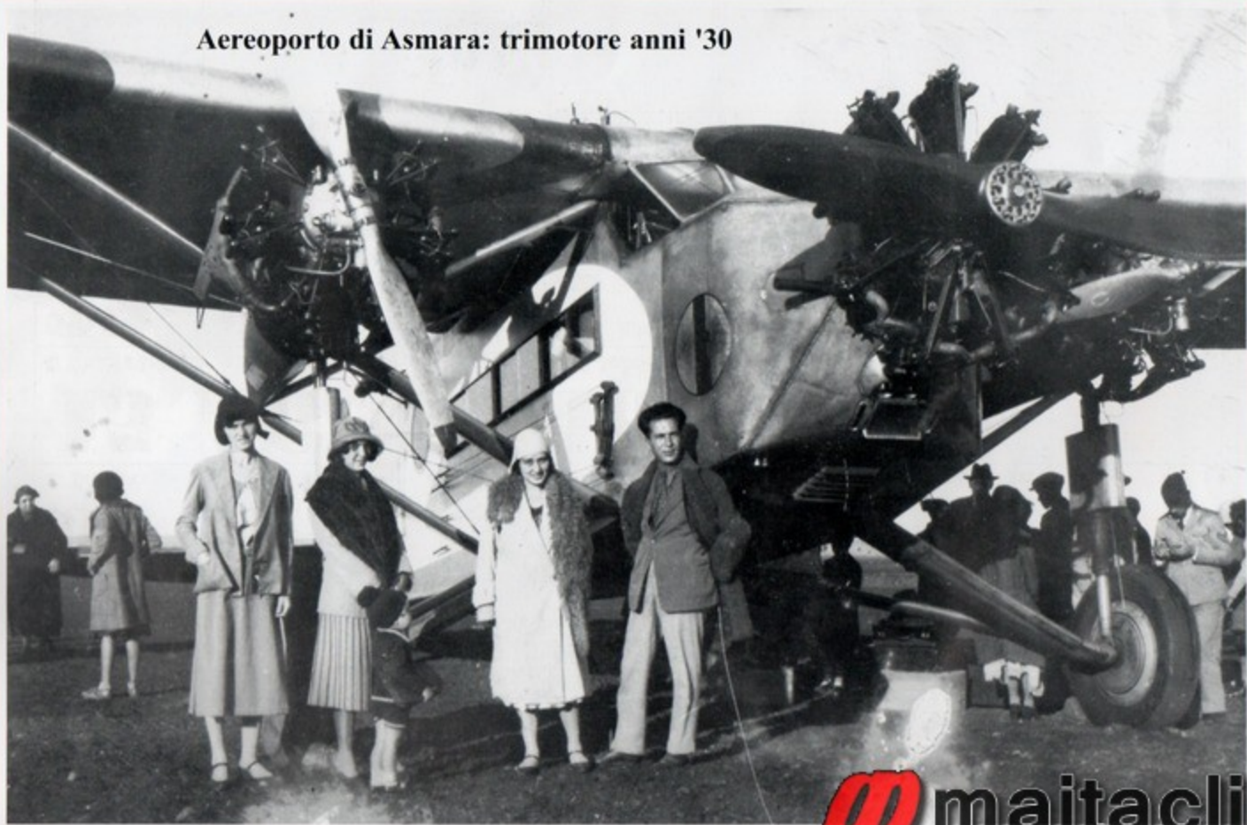
Aeroporto di Asmara: trimotore anni '30