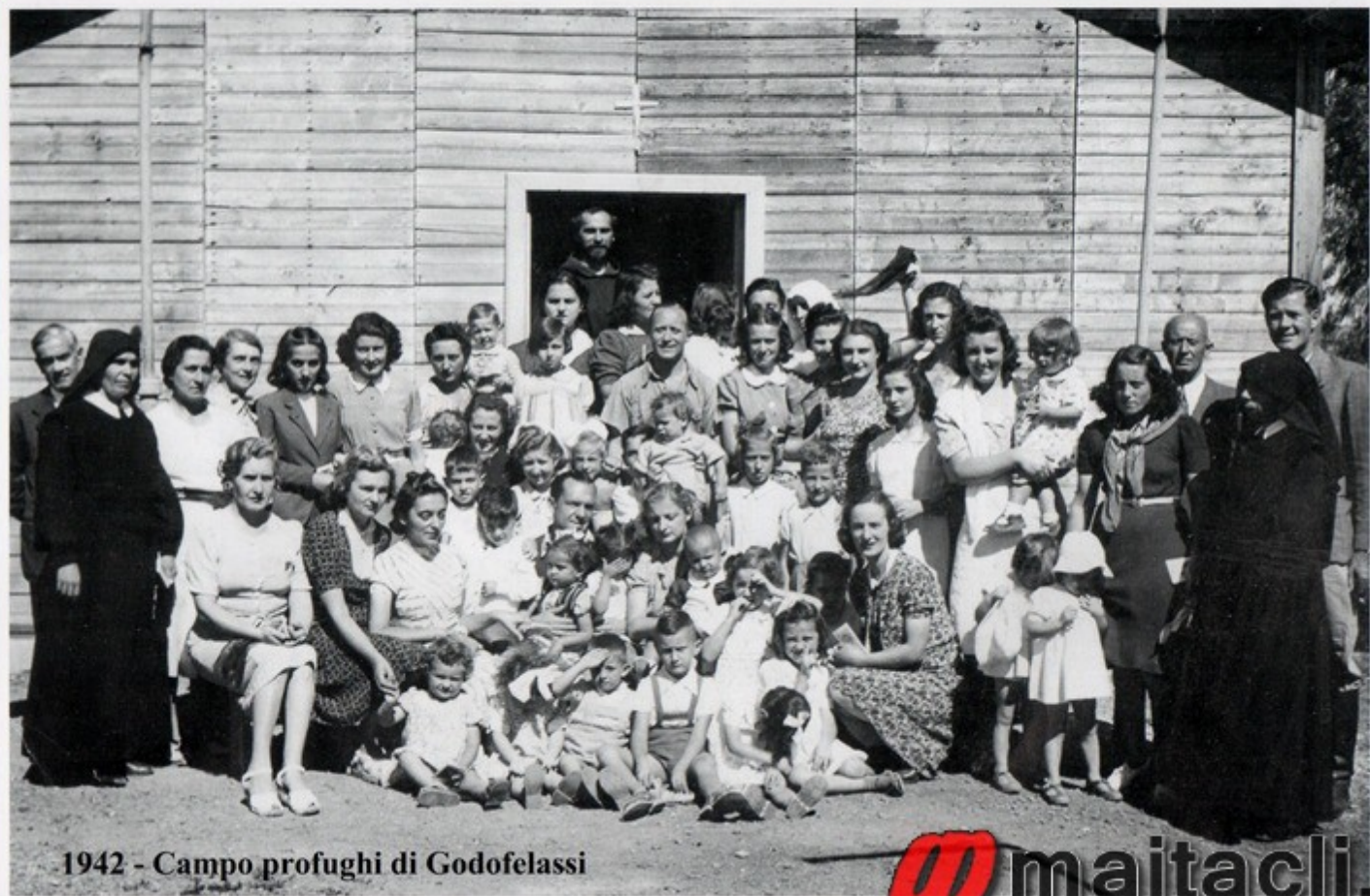
1942 - Campo profughi di Godofelassi