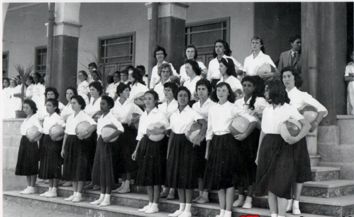
1959 - Ist. Magistrale A.Galliano - Saggio ginnico