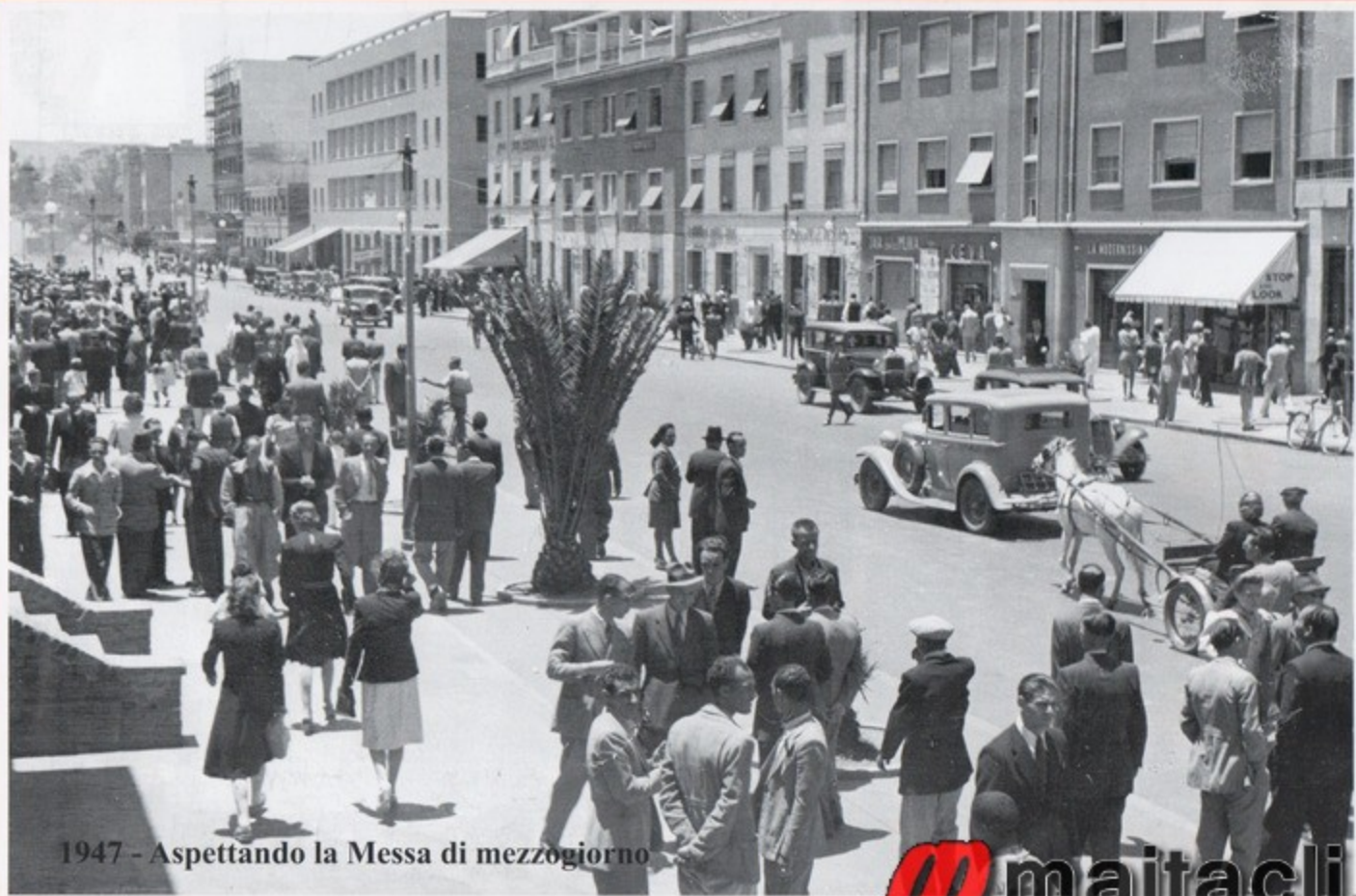
1947 - Aspettando la Messa di mezzogiorno